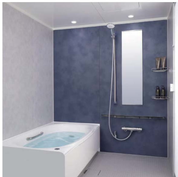
リノビオV施工例（左：Nタイプ、右：Fタイプ）

まず素材感と高級感を際立たせホテルライクな空間をめざしたNタイプを新設しました。オーバーヘッドシャワーとハンドシャワーがそれぞれ愉しめ、スタイリッシュなシャワーシステム（OG1）や収納棚などにメタルアイテムを標準装備し、上質な空間を演出します。またさりげなく入浴をサポートするスマートエスコートバーや、ワイドレバー水栓などを設定し、使い勝手と質感にこだわった空間を提案するKタイプ、マンションの狭小空間でも洗い場が広々使え、とるピカスリムカウンターや、フルフォールシャワーを標準装備して快適な入浴を提案するFタイプなど、全5タイプをご用意しました。