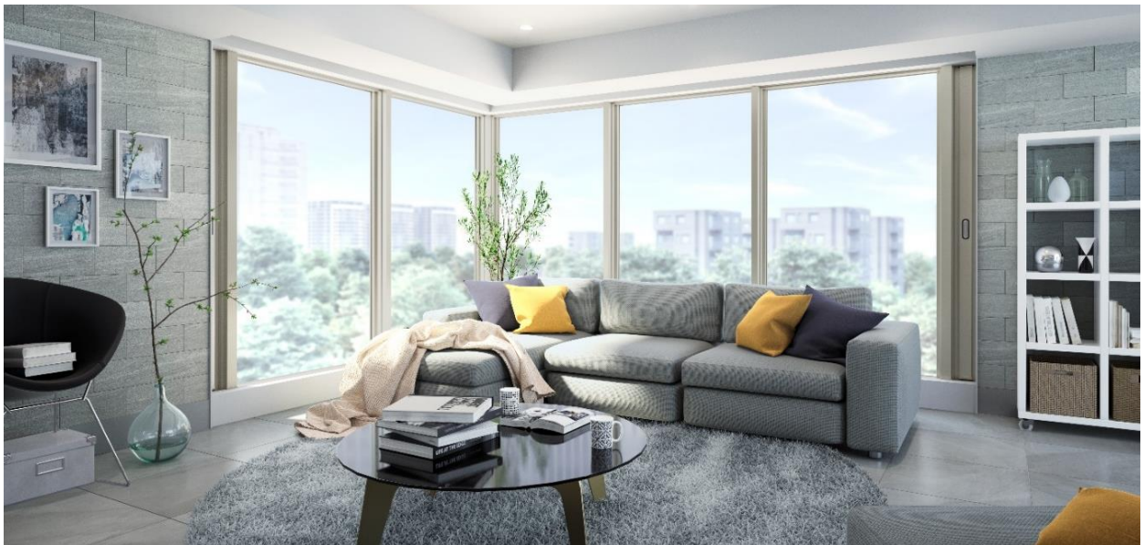
シーガルスリット イメージ写真

この度発売する美しいデザインと高機能を両立したビル用アルミサッシ「PRESEA-S」のFIX 窓（内押縁）耐熱強化ガラス仕様は、耐風圧性能 4,500Pa、水密性能最大 1,500Pa といった強度はさることながら、防火設備でありながら網目のない耐熱強化ガラスのためクリアな視界を実現します。これにより 30 階程度の超高層建築はもちろん、病院・ホテル・オフィス・幼稚園など様々なシーンにマッチします。