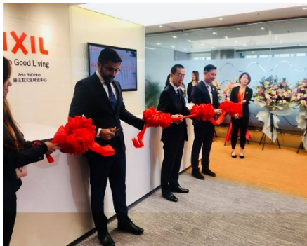
1月17日（木）に行われた開設記念式典

これまで LIXIL グループは中国市場を中心に先進的な水まわり製品を展開しながら成長を続けており、同国はアジア全体の開発において中心的な役割を担ってきました。LIXIL グループ本社のある日本、北米（American Standard）、そしてドイツ（GROHE）に続き、今回新設された 2,500 平方メートルの研究開発拠点は、LIXIL グループにとって最も多様な市場であるアジア向けの技術拠点として、当社がアジアで展開する全ての水まわりブランドの事業を網羅します。